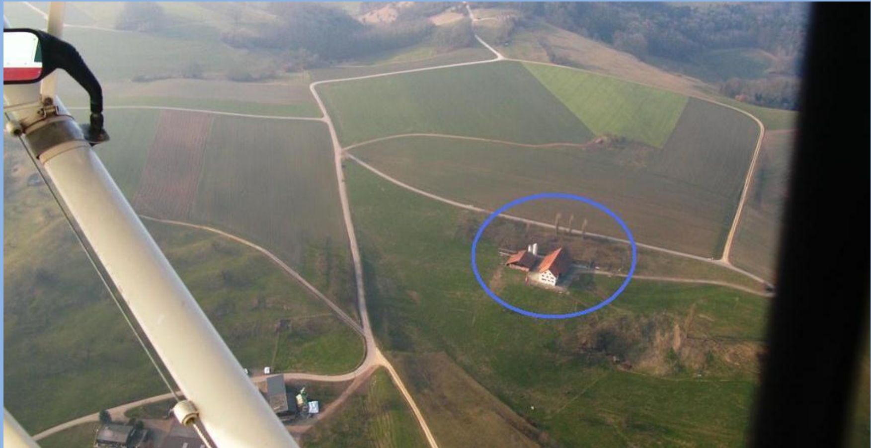
Foto: Hof mit 3 Pappeln