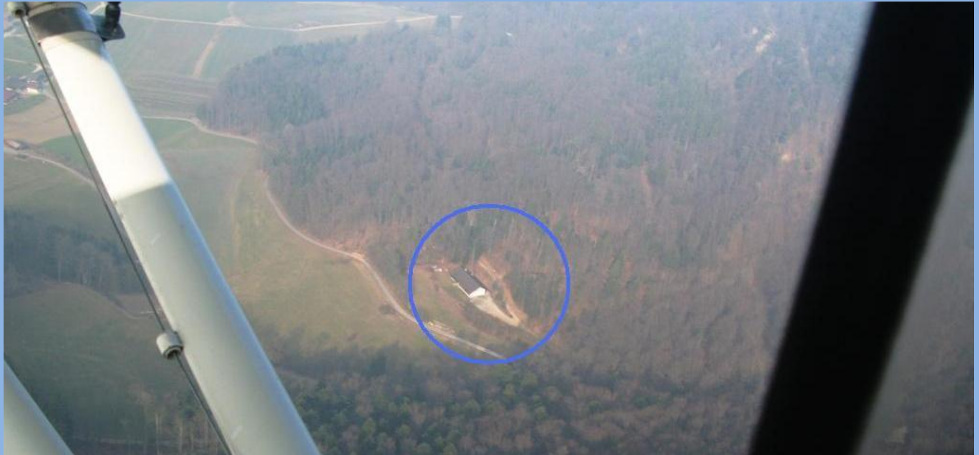
Foto: Schiesstand Wegenstetten

4. Schiesstand Wegenstetten. Liegt ziemlich genau auf dem Circuit Track, gut sichtbar in einem Waldausschnitt.