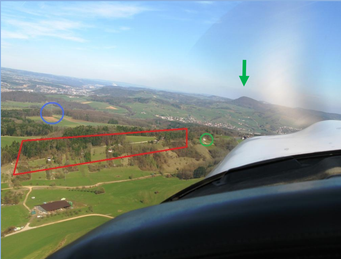
Foto: Als Richtpunkt kann das Wasserreservoir (grüner Kreis) und der Schinberg (A) als Fernziel (grüner Pfeil) genommen werden. Die Volte passiert dann das „Waldviereck mit Mast“ (blauer Kreis).